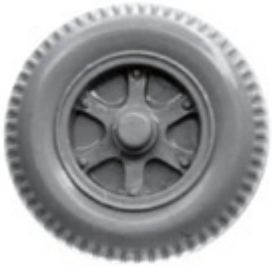
Räder einteilig 12 mm mit Trilexfelge ➔ R 632 xx