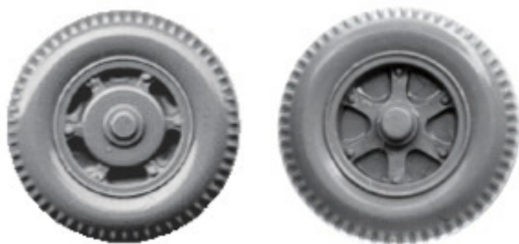
Räder einteilig 12 mm mit Trilexfelge → R 631/R 632 xx