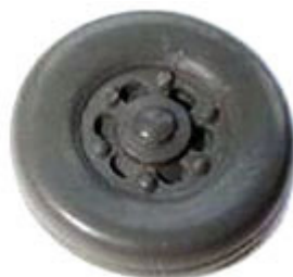
Räder einteilig 12,3 mm Trilexfelge mit flachen Flanken ➔ R 621 xx