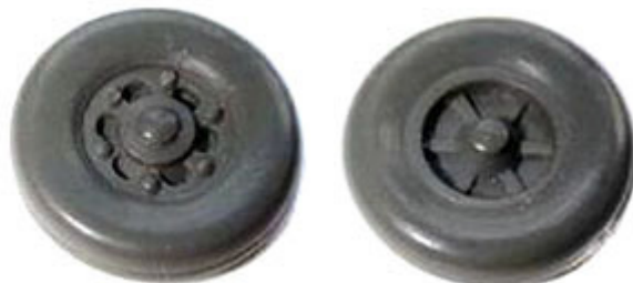
Räder einteilig 12,3 mm Trilexfelge mit flachen Flanken ➔ R 621/R 622 xx