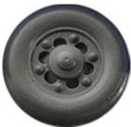
Räder einteilig 12,3 mm Trilexfelge mit runden Flanken ➔ R 611 xx