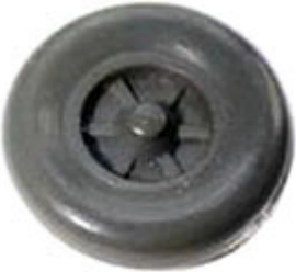
Räder einteilig 12,3 mm Trilexfelge mit flachen Flanken → R 622 xx