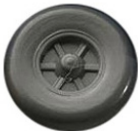
Räder einteilig 12,3 mm Trilexfelge mit runden Flanken ➔ R 612 xx