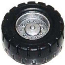
Räder zweiteilig 6,8 mm mit Felge ➔ R 606 xx