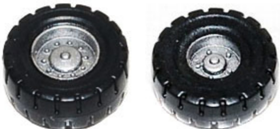
Räder zweiteilig 6,8 mm + 6 mm mit Felge ➔ R 606/R 607 xx