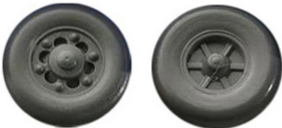
Räder einteilig 12,3 mm Trilexfelge mit runden Flanken ➔ R 611/R 612 xx