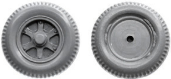
Räder einteilig 12 mm mit Trilexfelge ➔ R 632/R 633 xx