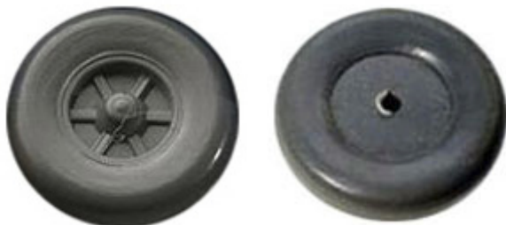
Räder einteilig 12,3 mm Trilexfelge mit runden Flanken ➔ R 612/R 613 xx