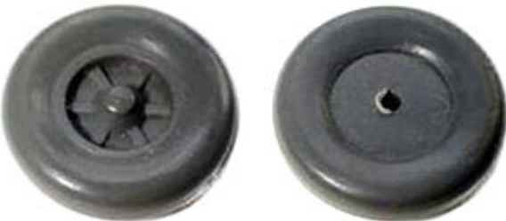
Räder einteilig 12,3 mm Trilexfelge mit flachen Flanken → R 622/R 623 xx